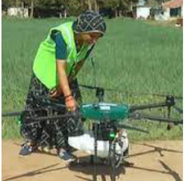
બનાસની 'ડ્રોન દીદી': આશાબેન ચૌધરીએ છ મહિનામાં ડ્રોનથી દવા છંટકાવ કરીને રૂ.1 લાખની કમાણી કરી

છંટકાવ કરતા શીખવવાનો છે. ડ્રોન દીદી યોજના માટે 10 થી 15 ગામોની સ્વસહાય જૂથની મહિલાઓને એક સાથે તાલીમ આપવામાં આવે છે, જેમાં ડ્રોન ચલાવવા માટેની 15 દિવસની તાલીમ