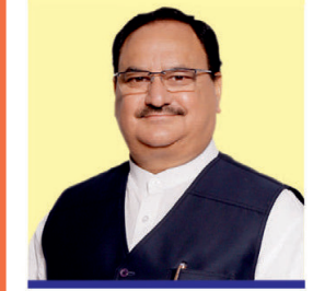
શ્રી જે. પી. નંડા આરોગ્ય-પરિવાર કલ્યાણ અને કેમિકલ એન્ડ ફર્ટીલાઈઝર્સ (કેબિનેટ મંત્રી)