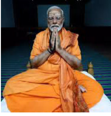
કન્યાકુમારીમાં વિવેકાનંદ શિલા સ્મારકને શ્રી એકનાથ રાનડેએ બનાવ્યું હતું, કાશ્મીરથી કન્યાકુમારી સુધી... દરેક દેશવાસીના હૃદયમાં આ આપણી સમાન ઓળખ છે

લોકશાહીના જન્મદાતા દેશમાં લોકશાહીનું એક સૌથી મોટું પર્વ સમાપ્ત થઈ ગયું છે. કન્યાકુમારીમાં ત્રણ દિવસની આધ્યાત્મિક યાત્રા પછી, ઘણા બધા અનુભવો છે... હું મારા અંદર અનંત ઊર્જાનો પ્રવાહ અનુભવી રહ્યો છું. ખરેખર, ૨૪ની આ યૂંટણીમાં ઘણા સુખદ સંયોગો બન્યા છે. અમૃતકાળની આ પ્રથમ લોકસભા યૂંટણીમાં મેં ૧૮૫૭ના પ્રથમ સ્વતંત્રતા સંગ્રામના પ્રેરણા સ્થળ મેરઠથી પ્રચારની શરૂઆત કરી હતી. મા ભારતીની પરિક્રમા સમયે આ યૂંટણીની મારી છેલ્લી સભા પંજાબના હોશિયારપુરમાં યોજાઈ હતી. ત્યાર પછી મને કન્યાકુમારીમાં ભારત માતાના ચરણોમાં બેસવાની તક મળી. એ શરૂઆતની ક્ષણોમાં મન-મસ્તિષ્કમાં યૂંટણીનો ઘોંઘાટ ગૂંજતો હતો. રેલીઓ અને રોડ શોમાં જોયેલા અસંખ્ય ચહેરાઓ મારી નજર સમક્ષ આવી રહ્યા હતા. માતાઓ, બહેનો અને પુત્રીઓના અપાર પ્રેમની એ લહેર, તેમના આશીર્વાદ... તેમની આંખોમાં મારા માટેનો વિશ્વાસ, એ સ્નેહ... હું બધું જ ગ્રહણ કરી રહ્યો હતો. મારી આંખો ભીની થઈ રહી હતી... હું શૂન્યતામાં જઈ રહ્યો હતો,