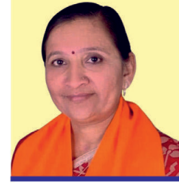
શ્રીમતી નિમુબેન બાંભણીયા ગ્રાહક સુરક્ષાની બાબતો, કુડ એન્ડ પબ્લિક કિસ્કોનિયુશન (રાજ્યકક્ષાના મંત્રી)

ગુજરાતના પનોતા પુત્ર, વડાપ્રધાન શ્રી નરેન્દ્રભાઈ મોદીના મંત્રીમંડળ 3.0માં ગુજરાતમાંથી સમાવેશ થવા બદલ તમામને અભિનંદન અને શુભેચ્છાઓ.