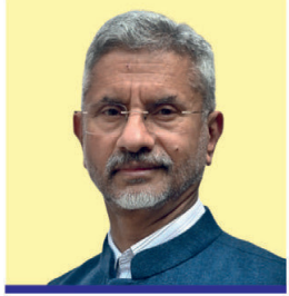
શ્રી એસ. જયશંકર વિદેશ મંત્રાલય (કેબિનેટ મંત્રી)