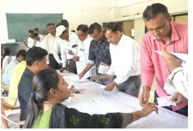
અનુસંધાન પાના નંબર : ૨

વિદેશી નિરીક્ષકોએ છ રાજ્યોમાં ચૂંટણીનું નિરીક્ષણ કરીને તેમના દેશમાં પણ આ રીતે ચૂંટણીઓ યોજી શકાય એવો મત પણ વ્યક્ત કર્યો. ગયા મહિને જ, યુએસ સ્ટેટ ડિપાર્ટમેન્ટે સ્પષ્ટતા કરી હતી કે અમારો દેશ ભારતમાં કોઈ ચૂંટણી નિરીક્ષકો મોકલવાના મતના નથી, પરંતુ સત્તામાં ભાગીદારો સાથેના અમારા સહયોગને વધુ ગાઢ અને મજબૂત કરવા આતુર છે. જર્મનીના રાજદૂત ફિલિપ એકરમેને કહ્યું કે જર્મની ભારતમાં યોજાઈ રહેલી વિશ્વની સૌથી