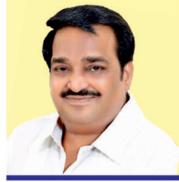
શ્રી સી. આર. પાટિલ જલશક્તિ મંત્રાલય (કેબિનેટ મંત્રી)