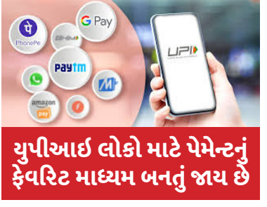
યુપીઆઈ લોકો માટે પેમેન્ટનું ફેવરિટ માધ્યમ બનતું જાય છે

વ્યવહારોની સરેરાશ રકમ રૂ. 65,966 કરોડ રહી છે. ઓંકડા અનુસાર, વાર્ષિક ધોરણે આ 49 ટકાની વૃદ્ધિ છે. UPI દ્વારા થતા ટ્રાન્ઝેક્શનમાં જબરદસ્ત વધારો જોવા મળ્યો છે. જો આપણે ઓંકડાઓ પર ભરોસો કરીએ તો, મે મહિનામાં UPI દ્વારા કરવામાં આવેલા વ્યવહારોનું કુલ મૂલ્ય 20.45 લાખ કરોડ રૂપિયા હતું. જ્યારે એપ્રિલ મહિનામાં થયેલા વ્યવહારોની રકમ 19.64 લાખ કરોડ રૂપિયા હતી. ઓંકડા મુજબ એક મહિનામાં ચાર ટકાથી વધુનો વધારો જોવા મળ્યો છે. ઉલ્લેખનીય છે કે થોડા સમય પહેલા રિઝર્વ બેંકે જાહેરાત કરી હતી કે UPIને દેશની બહાર પણ લઈ જવામાં આવશે અને તેને એક લોકપ્રિય ટ્રાન્ઝેક્શન પ્લેટફોર્મ બનાવવામાં આવશે. આરબીઆઈનું લક્ષ્ય નજીકના ભવિષ્યમાં 20 દેશોમાં UPIનો ઉપયોગ કરવાનું છે. આ શ્રેણીમાં શ્રીલંકા, નેપાળ, UAE સહિત ઘણા દેશોમાં UPI દ્વારા ટ્રાન્ઝેક્શન શરૂ થઈ ગયું છે.